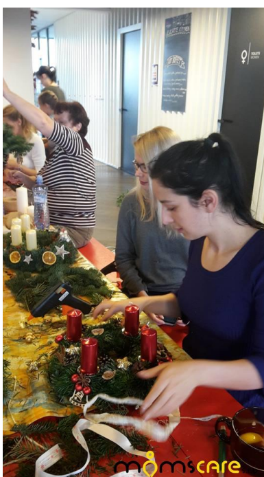
Obrázek 7- Kreativní workshop - Vánoční tvoření