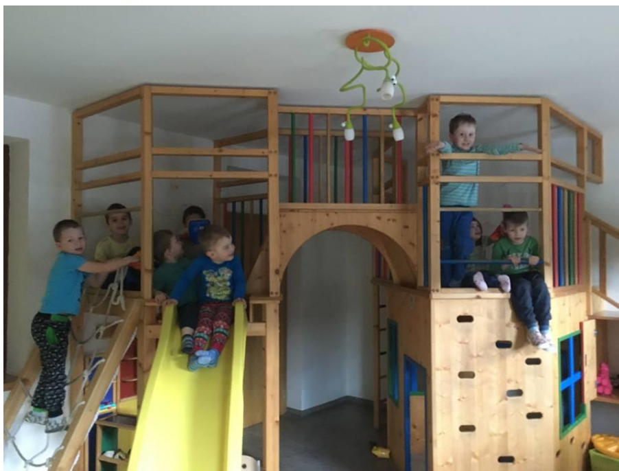
Obrázek 2- Prvním dětská dovolená v Malé Dolní Úpě

V září 2018 jsme otevřely nový Tematický den ve společnosti Avast software s.r.o. na brněnské pobočce. Rádi bychom do budoucna své služby nabízely v nových organizacích a na konferencích.