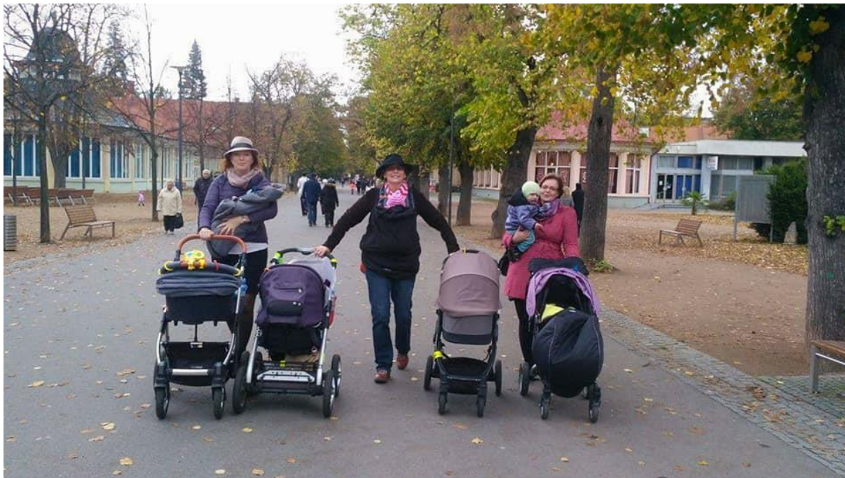
Obrázek 1- hlídání dětí klientkám během procedur

Koncem roku 2016 jsme založily společnost, již na jaře roku 2017 jsme pořádaly svůj první dámský víkendový dýchánek, kde byla kapacita pobytu plně obsazena. Tuto akci jsme zopakovaly na podzim téhož roku.