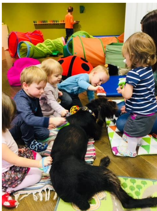
Obrázek 3- Tematický den – canisterapie

V září 2018 jsme otevřely nový Tematický den ve společnosti Avast software s.r.o. na brněnské pobočce. Rádi bychom do budoucna své služby nabízely v nových organizacích a na konferencích.