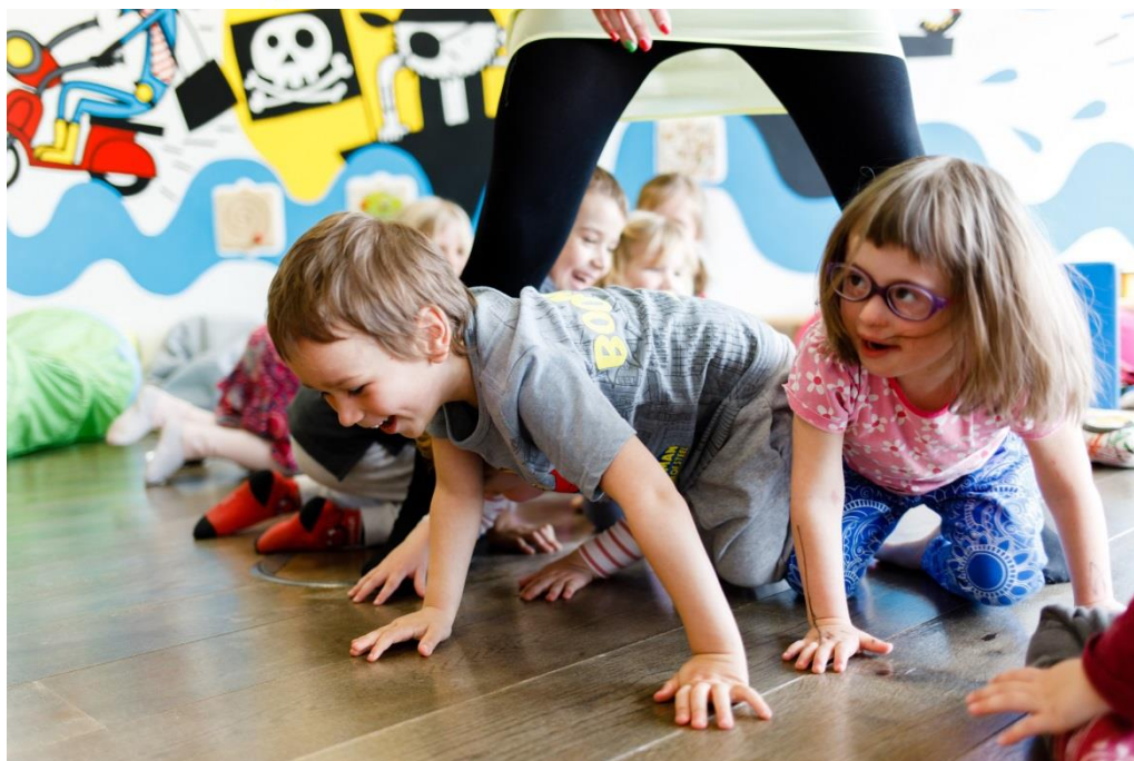
Obrázek 4- Tematický den